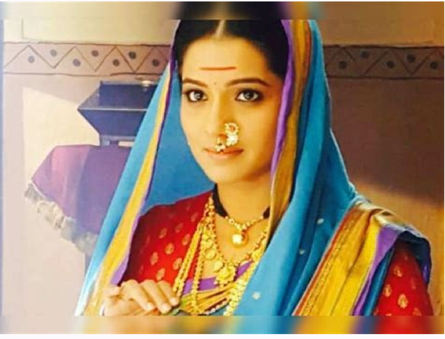
Ahilyabai holkar photo